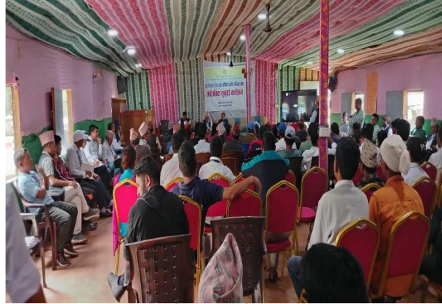
२०८१/२०८२ को सार्वजनिक सुनुवाइ कार्यक्रम